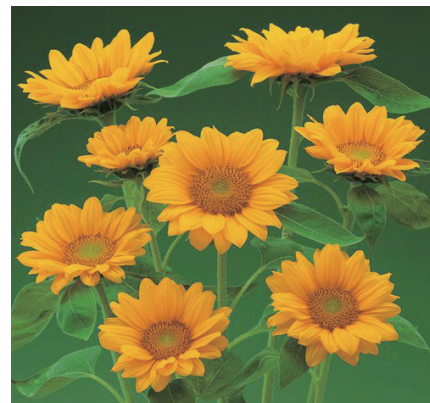
サンリッチUPフレッシュ ヒマワリ