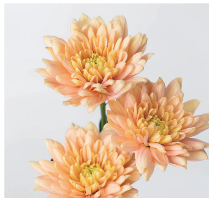
バルティカサーモン