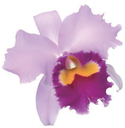
アイリーンフェニスプリングベスト