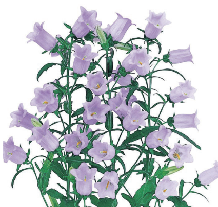
チャンピオンスカイブルー カンパニユラ