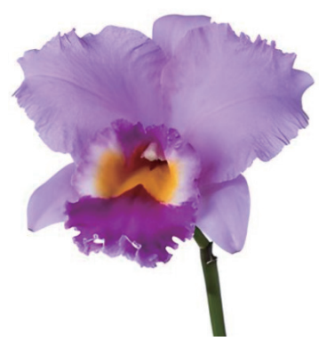
アイリーンフェニーポーラ