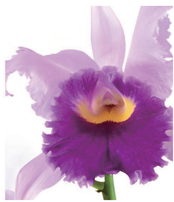
アイリーンフェニーイングリット