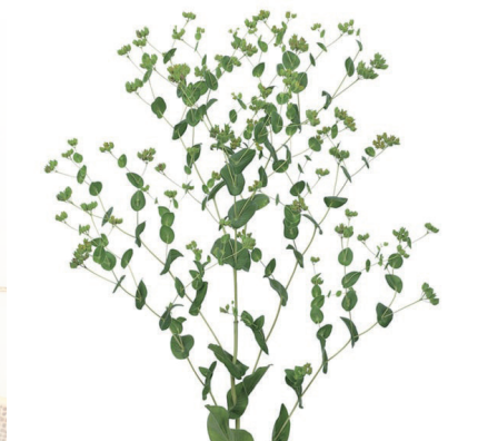
グリフティー プレウルム