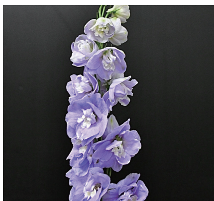
オーロララベンダー デルフィニウム