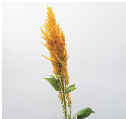
センチュリーイエロー ケイトウ