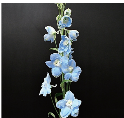
セレーノライトブルー デルフィニウム