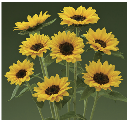
サンリッチUPオレンジ ヒマワリ