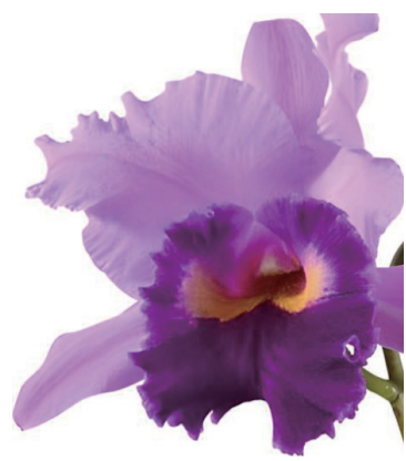
アイリーンフェニースーパー