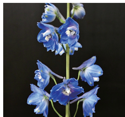
アズールブルー デルフィニウム