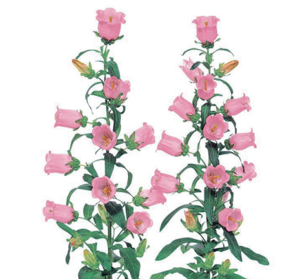
チャンピオンピンク カンパニユラ